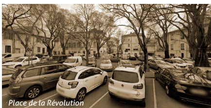
Place de la Révolution