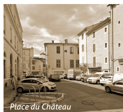
Place du Château