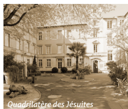
Quadrilatère des Jésuites